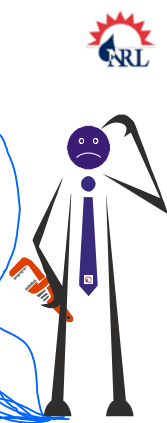
Illustrasjon av Bjarne Haugland