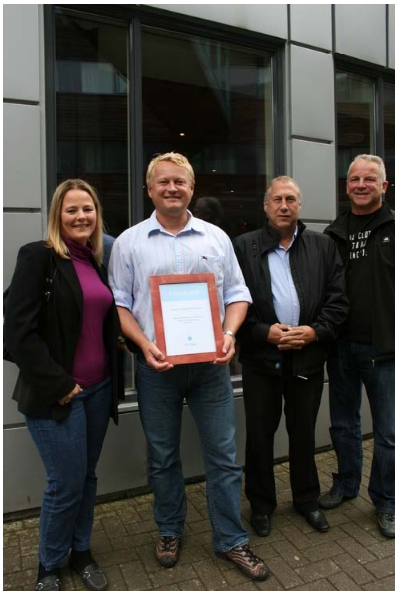
"Årets bedrift" 2008 - Porsgrunn Rørleggerbedrift, kåret av If